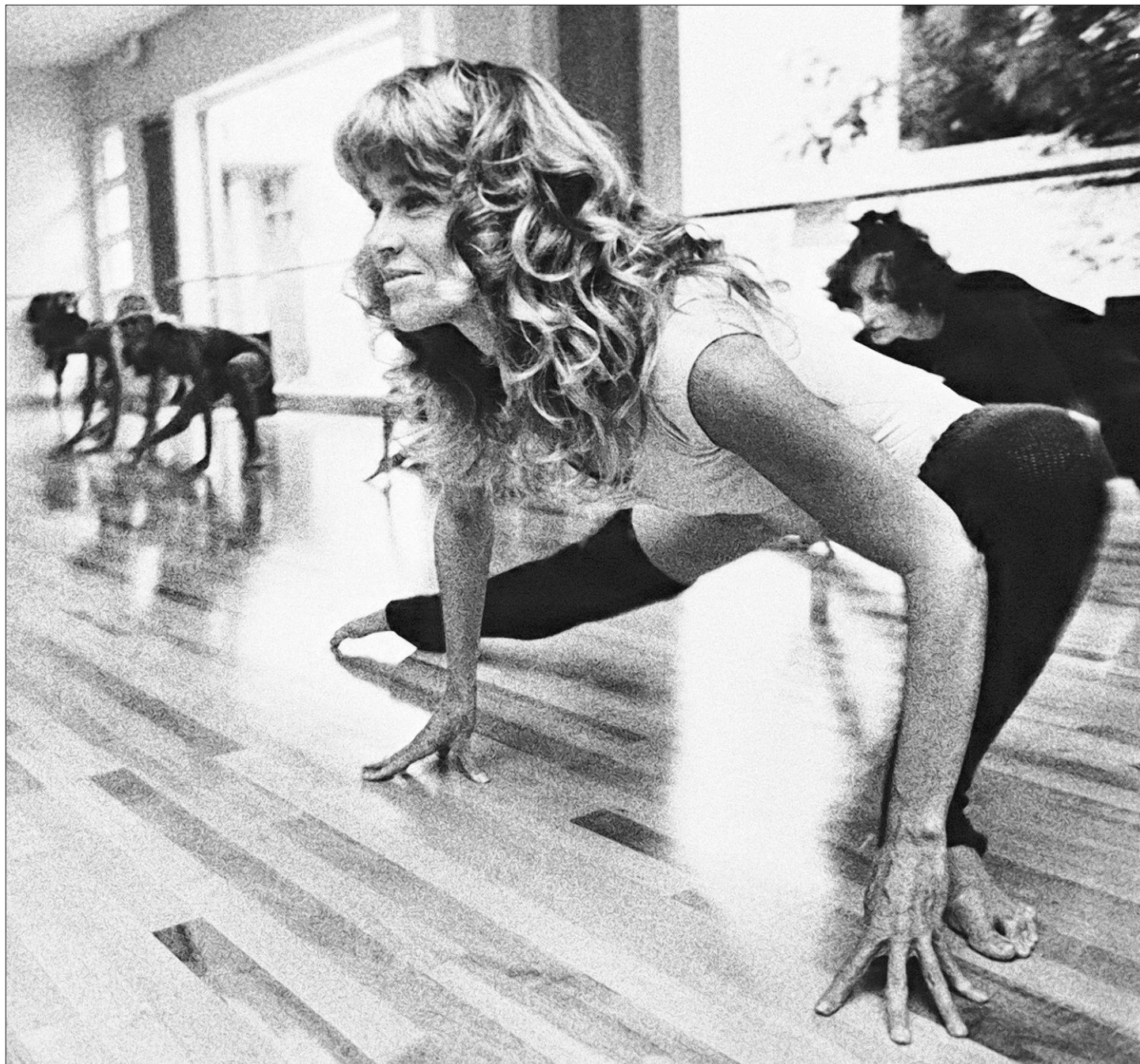
Mit Aerobic-Videos machte Jane Fonda Anfang der 80er Jahre Furore als Fitness-Queen, damals natürlich noch ohne Prothese